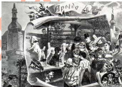
Pintura de la feria de canes del siglo XIX Criadores y simpatizantes festejando los 700 años de Apolda