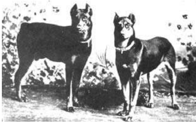
Graf y Gerhilde Ejemplares N° 1 y 2

Ambos ejemplares fueron criados por Goswin Tischler, pero luego pasaron a ser propiedad de Otto Göller, según datos del "Stud Book Alemán" de 1893. Se dice de "Graf", que era un autentico fuera de serie para su época, ganando numerosas exposiciones, y que además dejo descendientes como Ulrich v. Turingen, Hellegraf v. Turingen y Fedor v. Aphart - transmitiéndoles las dotes de elegancia y nobleza que lo caracterizaban.