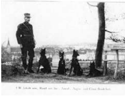
Militar entrenando Dobermann