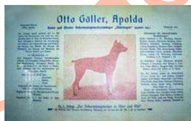
Panfleto Publicitario por Otto Göeller