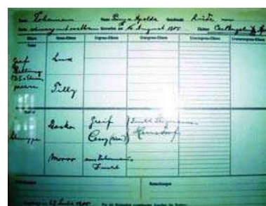
1º Pedigree de 1905, faltan Generaciones

Pero de un modo u otro, todos ellos llegaron a las mismas conclusiones, las cuales pasaremos a detallar y que comienzan de la siguiente manera. Todo parece indicar que su comienzo rondaría en la primera década del año 1860, y el lugar sería un pueblo llamado Apolda en la Turingia, por aquel entonces capital del Ducado de Sajonia-Weimar (Alemania).