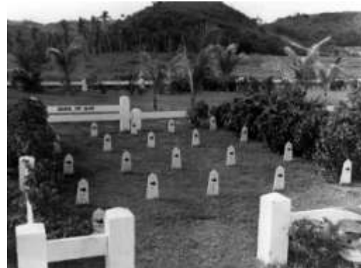
Cementerio de canes en la Isla de Guam