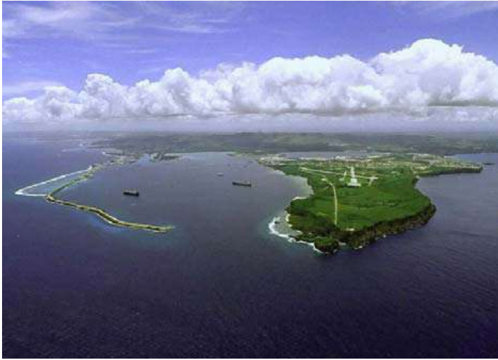
Vista área de la Isla de Guam Base "Orote Point" (USA)