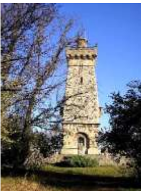
Torre de Bismarck

Y así comienza a cruzar una perra de tipo “Pinscher Alemán”, produciendo una hembra llamada “Bismarck”, cuyo nombre fuera cambiado más tarde por el de “Bisart”. Dicho cambio obedece a que en esa época el canciller “Bismarck” era una persona de gran importancia en el escenario político como para “ceder” su nombre a un perro, aunque el mismo fuera el fundador de una raza.