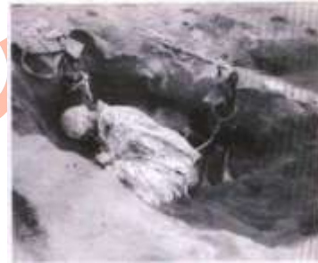
Dobermann haciendo guardia

Contando con él primer monumento en honor al perro de combate, un “Doberman Pinscher” en la Base Naval en Orote Point, (USA) por sus servicios durante esos periodos bélicos.