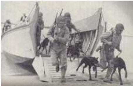
Desembarco Americano Grupo Canes Tropas Americanas en Guam

Luego vendría la 2° Guerra Mundial, y allí volvería a destacarse como “perro de guerra” convirtiéndose en la mascota del Grupo de Tareas de Marines de USA, logrando el famoso apelativo de “Devil Dogs”, (perros diablos).