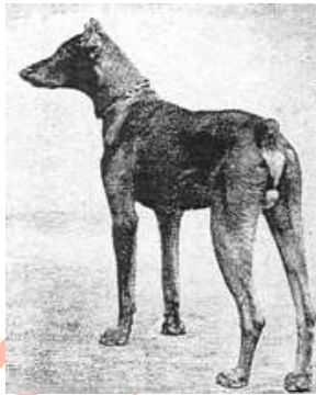
Hellegraf v. Turingen