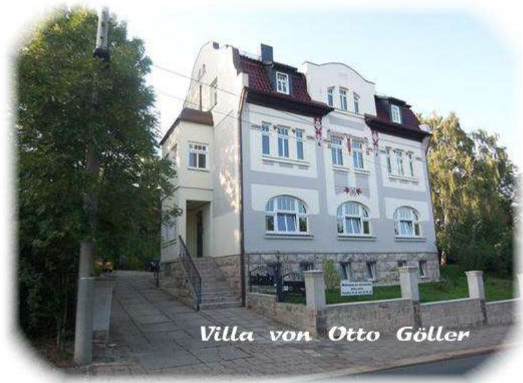
Monumento Histórico Villa Otto Göller (Vista Actual)

Este último fundaría el 27 de Agosto de 1899, el Dobermann Pinscher Club en Apolda, siendo el primer Club de la raza, y además ya era el propietario del famoso criadero “von Thüringen”. Allí y bajo su tutela, se registrarían los primeros criaderos con los afijos, von Thüringen, von Grönland y von Ilm Athen, continuando con la labor de selección de la raza. Es indudable que por los datos socavados por el Dobermann Club Alemán, la raza debe sus orígenes al aporte de las siguientes razas.