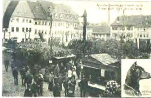
Viehmarkt u. Hundehandel, Marktplatz von Apolda 1889

Feria de Canes lugar en que fuera oficializada la raza 1889