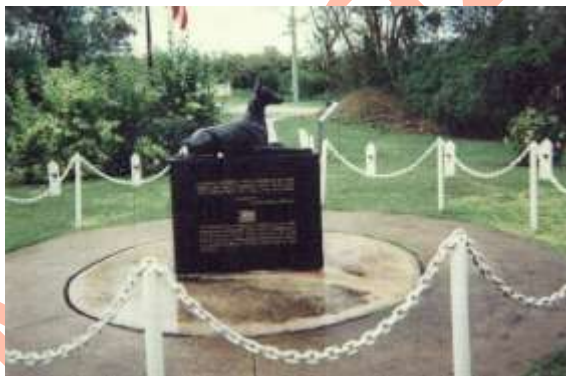
Monumento en la Isla de Guam “Dobermann Pinscher”

Contando con él primer monumento en honor al perro de combate, un “Doberman Pinscher” en la Base Naval en Orote Point, (USA) por sus servicios durante esos periodos bélicos.