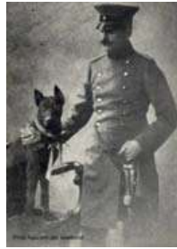
Policia de Época