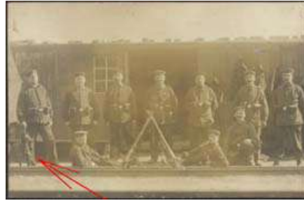
Compañía Alemana con Dobermann