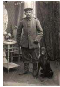
Militar con Dobermann

Luego vendría la 2° Guerra Mundial, y allí volvería a destacarse como “perro de guerra” convirtiéndose en la mascota del Grupo de Tareas de Marines de USA, logrando el famoso apelativo de “Devil Dogs”, (perros diablos).