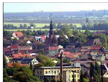
Apolda vista actual