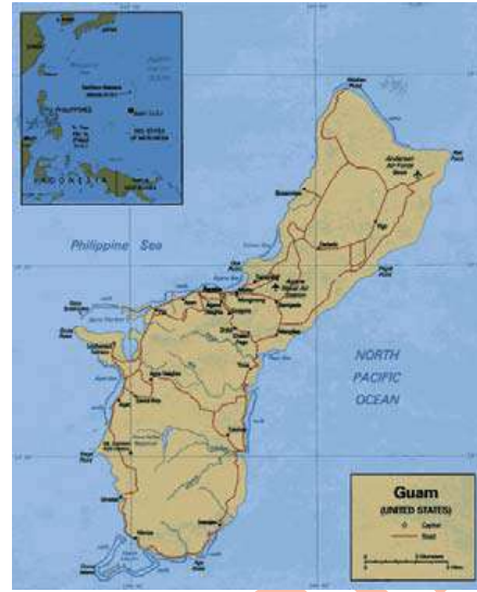
Ubicación geográfica de la Isla de Guam

Para concluir, hoy se trata de una de las razas más importantes del mundo, tanto del punto de vista cuantitativo como cualitativo, al ser un perro de Utilidad, Compañía y Protección con unas características muy difíciles de igualar.