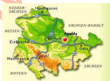
Mapa de la Zona de Apolda

Pero de un modo u otro, todos ellos llegaron a las mismas conclusiones, las cuales pasaremos a detallar y que comienzan de la siguiente manera. Todo parece indicar que su comienzo rondaría en la primera década del año 1860, y el lugar sería un pueblo llamado Apolda en la Turingia, por aquel entonces capital del Ducado de Sajonia-Weimar (Alemania).