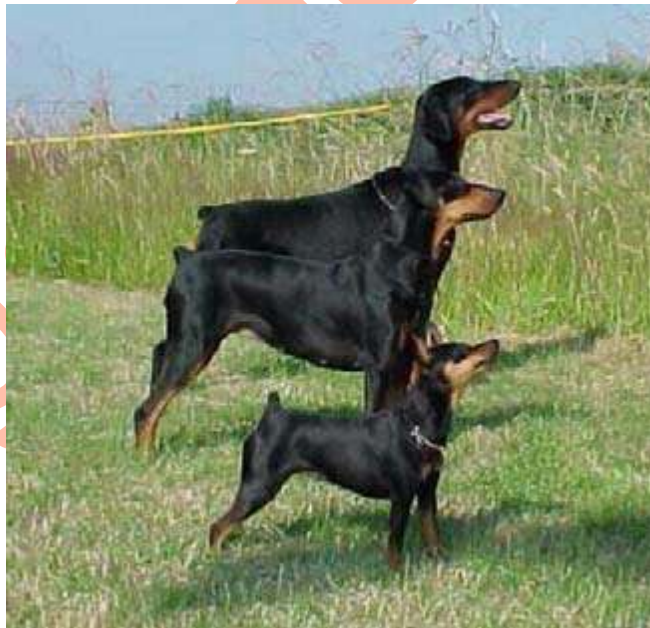
Hoy 3 tipos de Pinscher conocidos en el mundo Pinscher Miniatura, Pinscher Alemán y Dobermann Pinscher

Para concluir, hoy se trata de una de las razas más importantes del mundo, tanto del punto de vista cuantitativo como cualitativo, al ser un perro de Utilidad, Compañía y Protección con unas características muy difíciles de igualar.