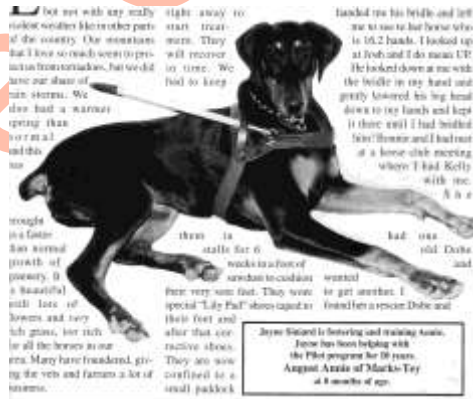
Ejemplar Annie con 8 meses de edad en entrenamiento