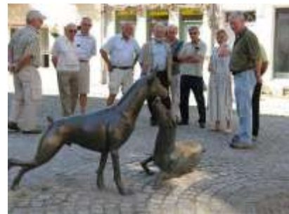
* Memorial Raza Dobermann en la ciudad de Apolda celebrando los 100 años de su creación. Escultor: Frau Kerstin Stöckel de Kapellendor