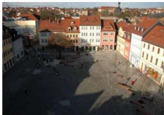
Vista actual año 2009 de la Plaza Marktsanierung "remodelada"