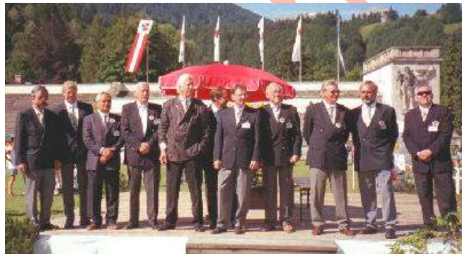
100 Jahre Dobermann Verein e. V. - Jubiläumsschau in Garmisch-Partenkirchen - 17.-18. Juli 1999