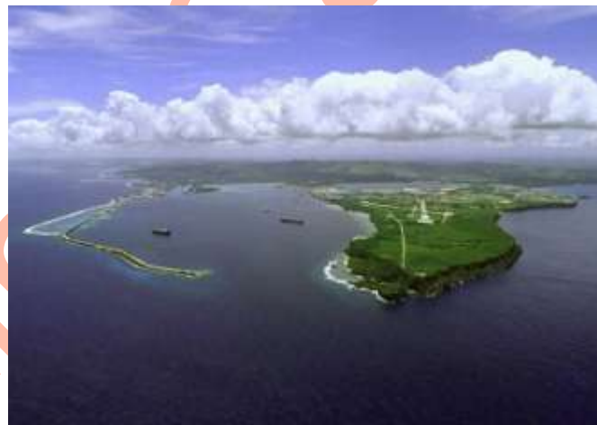
Vista aérea de la Isla de Guam - Base "Orote Point" U.S.A.