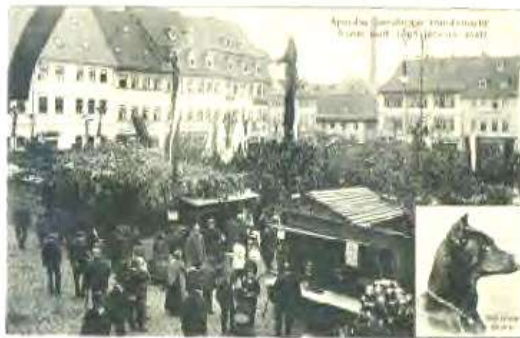
Viehmarkt u. Hundehandel, Marktplatz von Apolda 1889