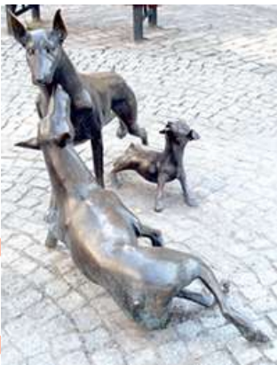
* Memorial Raza Dobermann en la ciudad de Apolda celebrando los 100 años de su creación. Escultora: Frau Kerstin Stöckel de Kapellendorf

Aquí al pie de la misma haremos mención de una poesía escrita en dialecto "Alemán – Dialecto/ Antiguo" (ya traducida), y que tomara vigencia en los 100 años de su creación en honor a la raza en la ciudad de "Apolda" - Alemania - cuna de la raza Dobermann.