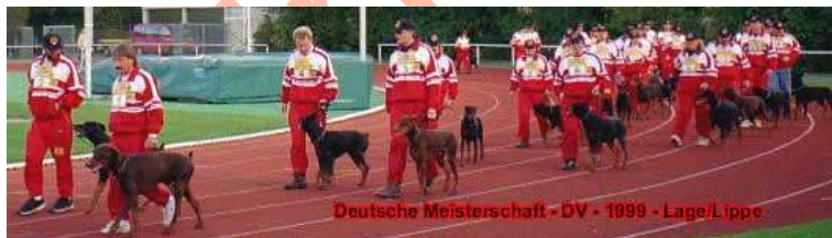
Máximo Campeonato del Dobermann Club Alemán 1999

Como parte de esta ocasión el Monumento conmemorativo del Dobermann (*foto) fue inaugurado el 11 de septiembre de 1999. El mismo muestra una familia de Dobermann.