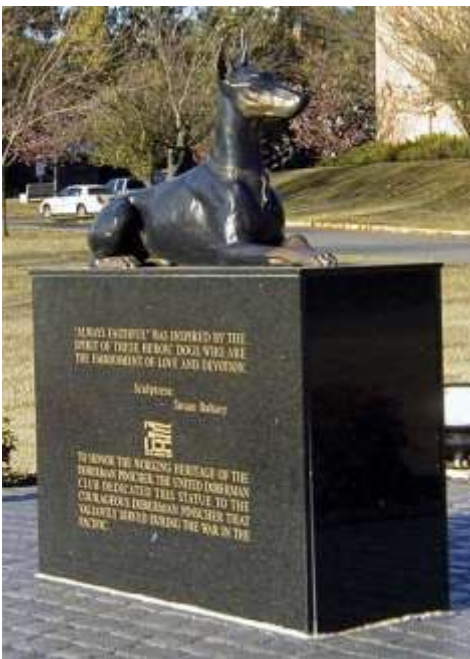
HISTORICAL The War Dog Memorial Statue Knoxville Tennessee

En agradecimiento a semejante labor durante la segunda guerra mundial, se levantan dos monumentos denominados "Siempre Fiel". El primero se encuentra en "Isla de Guam" en la base militar de USA en "Orote Point", y luego de ese mismo monumento se realizó una copia exacta que se encuentra en el estado de Tennessee - Knoxville - USA.