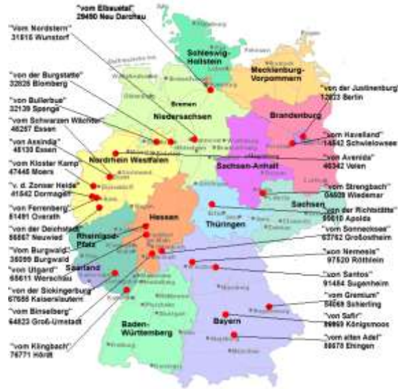
Alemania y su localización de Criaderos

Obviamente, se toman estas cosas, muy en serio, y no solo para esta raza en particular, también conservan el mismo espíritu las demás razas de Guardia "Alemanas", utilizando para ello otro sistema que hasta hace poco tiempo se llamaba Schutzhund (Sch H) (Prueba del Perro de Defensa), y que hoy se la conoce como VPG: (Vielseitigkeit Prüfung fur Gebrauchshund) (Prueba de Múltiples Funciones para perros de Utilidad), y que son pruebas para medir la capacidad de su Función Zootécnica, las cuales se van midiendo por su grado de complejidad.