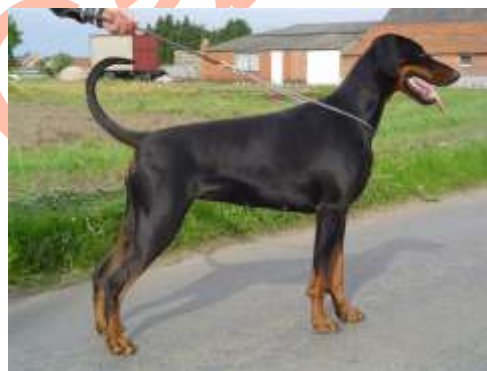
Dobermann Europeo en la Actualidad

Son tan notorias las diferencias, que hasta en los Show, la forma de mostrar al ejemplar son diferentes, amen de los aptos de Cría, que son muy rigurosos en Alemania.