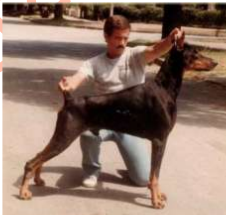
Altar's Midas by Demetrius y Sr. Héctor Iriarte

“Midas” fue uno de los últimos hijos de “Demetrius” en nacer y sin duda el mayor reproductor de la raza en América del Sur.