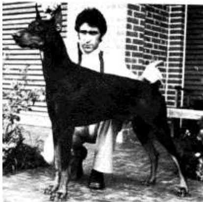
Marienburg's Genghis Kan