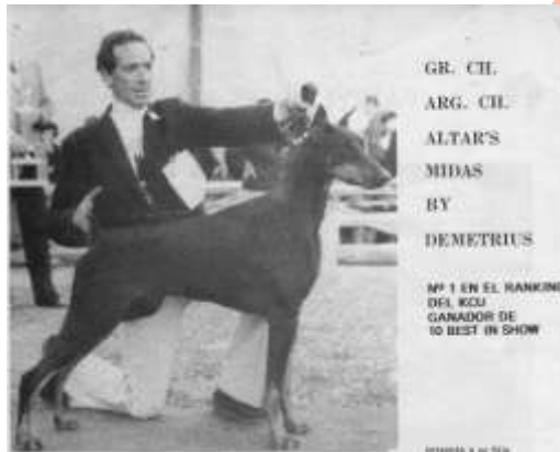
Gr. Ch. Arg. Ch. Urug. Ch. Br. Ch. Int. Altar's Midas by Demetrius