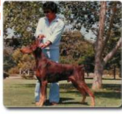
Am. Ch. Marienburg’s Sun Hawk

También tuvo su contribución para el mayor reproductor de la raza, “Sun Hawk”, quién tenía sus principales hijos campeones de hembras hijas de “Demetrius”.