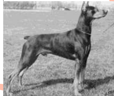
Am.Ch. Damasyn The Boatswain

Otro gran nombre en su pedigree fue Rancho Dobe's Storm, el fue el único Dobermann en toda la historia en vencer dos veces el B.I.S. en Westminster.