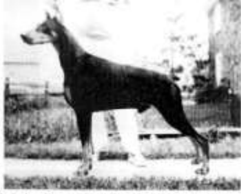
Am. Ch. Gra-Lemor Demetrius V.D. Victor