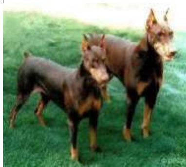
Criptonite y Indy