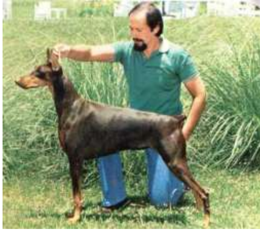
Ch. Int. Marienburg's Sun Bonnet – Bam-Bam