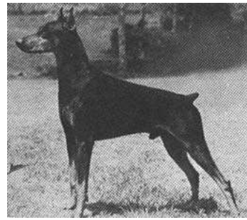
Am Ch. Steb's Top Skipper