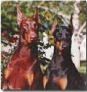
Sun Hawk y Only One