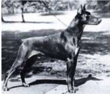
Am. Ch. Dictator V. Glenhugel