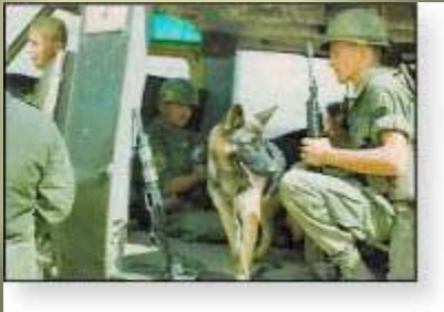
Como no, aerotransportado

A partir del aeródromo Bac-Mai, situado cerca de Hanói, se enfundaban los perros en una especie de bolsa, cerrada bajo el vientre y con 4 aberturas en las patas. Como cada nuevo vuelo excitaba siempre a los perros, los cuales gruñían, para contrarrestar su impaciencia, se les ponía una especie de caperuza con anteojera, que les era sacada después de unas horas en el avión, cuando se acostumbraban al ambiente.