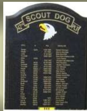
Placa recordatoria con los nombres de los canes caídos en combate de la 101 aerotransportada

Muchas veces perros y guías tocaban el suelo separados por centenares de metros, pero tardaban poco tiempo en reunirse. La siguiente hazaña del ovejero "Arras," permite apreciar la utilidad de los "servicios", que prestan estos perros.