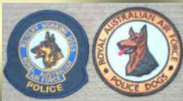
Insignia de la unidad australiana encargada de los perros

Poco antes de llegar a la meta, cuando los hombres ya se preparaban, los perros movían nerviosamente las colas, ladran y saltan sobre su guía; de vez en cuando un perro gruñe con su pelo erizado, pero apenas disminuye la velocidad del avión, para permitir el salto- cosa que se puede percibir, por el ruido de los motores, los perros entienden que ha llegado el momento de cumplir con su deber, y se ponen junto a su guía; luego un breve llamado y ambos se precipitan al vacío. A los perros que se resisten, se les presta una pequeña ayuda.