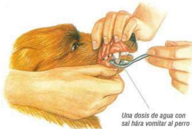
Una dosis de agua con sal hará vomitar al perro