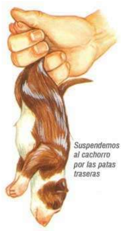
Suspendemos al cachorro por las patas traseras

Si, tras frotar al cachorro con una toalla sigue sin respirar, debemos suspender a la cría por las patas traseras durante unos segundos, para que expulse fluidos acumulados en las vías respiratorias. Sujetándole de forma segura por las patas traseras le agitamos suavemente. Esto debería estimular la respiración